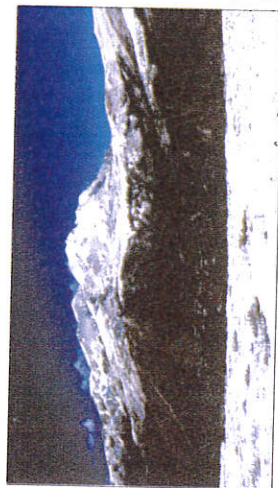
Le pic de Madres.

douces, cette montagne étonne par sa diversité. Son climat rude n'altère en rien sa vocation de paradis du randonneur et du botaniste. Les vastes hêtraies-sapinières précèdent les pelouses d'altitude, estives réputées. Lavandes, thym et romarins côtoient les rhododendrons et le fameux lys des Pyrénées. Aconits et belladones, belles vénéneuses, voisinent avec gentianes et réglisses.