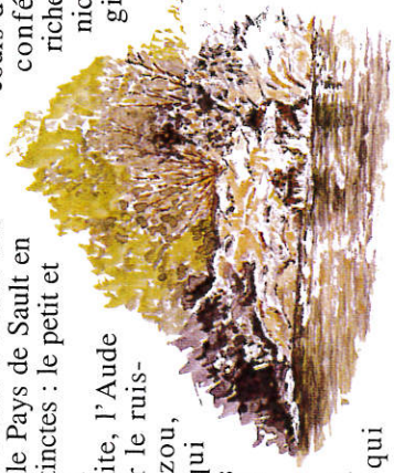
Le Rébenty. Dessin J.-C.C.

Marsa se situe au cœur de la vallée du Rébenty. Cet affluent de la rive gauche de l'Aude prend sa source au col du Pradel à 1680 m d'altitude. Son cours s'étend sur 40 km, coupant le Pays de Sault en deux parties distinctes : le petit et le grand plateau. Sur sa rive droite, l'Aude est rejointe par le ruisseau d'Aguzou, l'Ayguette (qui naît aux Clottes de Madres à 1850 m) et le ruisseau d'Aliès. Quant à la Boulzane, qui descend les pentes du pic Dourmidou (1843m), elle a choisi de devenir catalane en se jetant dans l'Agly. Cette profusion de rivières et de cours d'eau a, de tout temps, conféré au territoire sa richesse. Voie de communication, source d'énergie, bienfait curatif, espace de loisir, l'eau, source de vie souvent jalousee, continuera à inspirer bien des rêves.