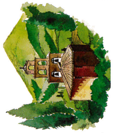
Le clocher de Marsa. Dessin R.-P.J.