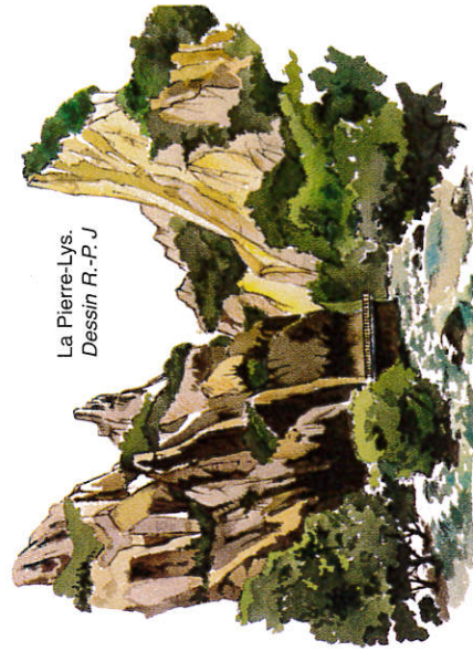
La Pierre-Lys. Dessin R.-P. J.

5 Sortir du bois sur un grand dégagement herbu. C'est le col de Saint Martin. Près d'un immense hêtre, bifurquer à gauche en suivant un sentier qui descend très raide dans les feuillus (marche, dans la caillasse malaisée). Traverser un ruisseau à sec pour déboucher dans les prairies et les premières maisons du village.