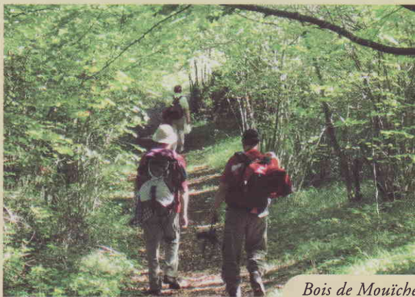
Bois de Mouïche

4. Traverser le hameau de Campeille et descendre au village de Puivert par la route D 16. Profiter de cette halte à Puivert pour découvrir le village : château, musée du Quercorb, sentiers thématiques, lac, commerces et artisans.