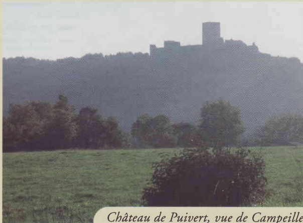
Château de Puivert, vue de Campeille

4. Traverser le hameau de Campeille et descendre au village de Puivert par la route D 16. Profiter de cette halte à Puivert pour découvrir le village : château, musée du Quercorb, sentiers thématiques, lac, commerces et artisans.