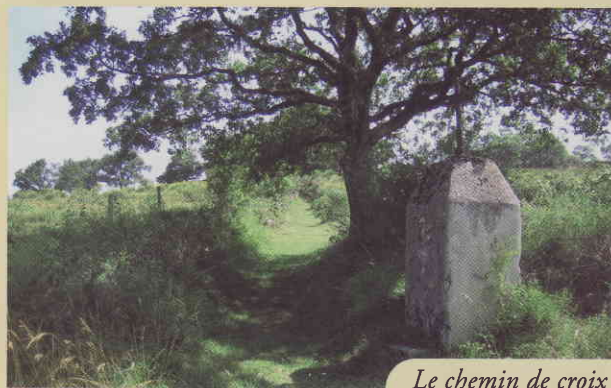
Le chemin de croix

Panneau 3 : "Pourquoi suis-je là ? 14 stations pour se recueillir" Au début de l'été, les genêts en fleur annoncent l'arrivée sur le promontoire dont l'entrée est balisée par deux nouvelles croix. Des bancs invitent à une pause contemplative.