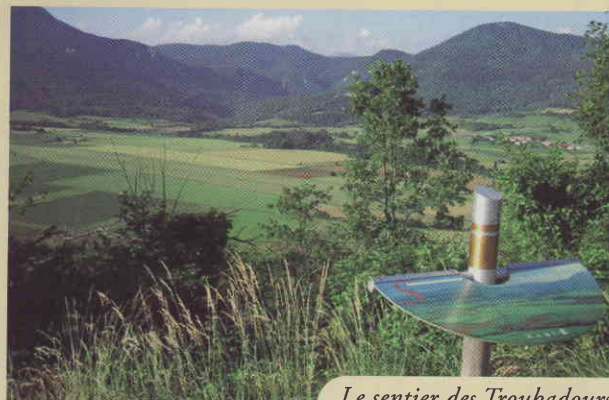
Le sentier des Troubadours