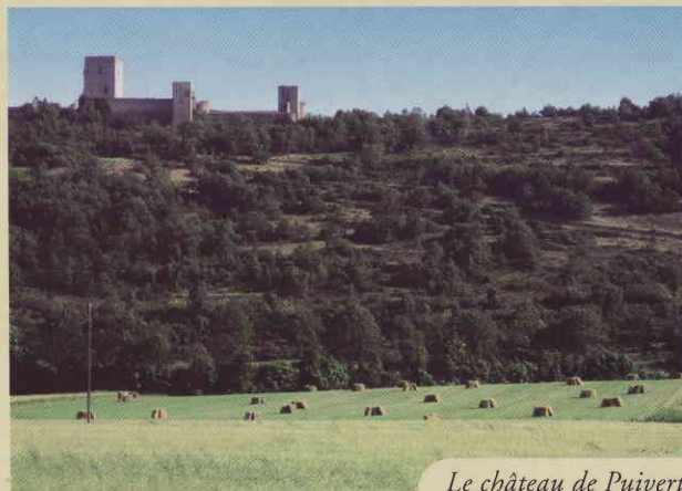
Le château de Puivert

1. Du Verger du Musée, descendre vers la rue Barry du Lion. Tourner à gauche et suivre la rue. Prendre la piste à gauche avant la dernière maison et le pont. Rejoindre Campferrier, situé à environ 1 km.