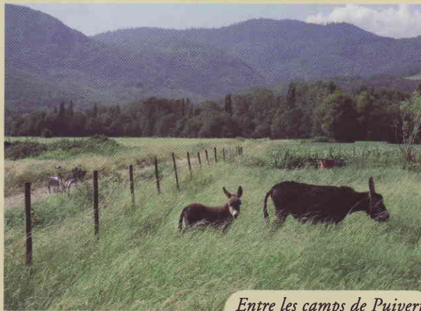
Entre les camps de Puivert

8. Au hangar, prendre la piste tout droit, en direction de Puivert. Longer la piste de vol à voile, puis rejoindre la route au bout d'1,5 km. Tourner à gauche, contourner le lac et revenir au musée du Quercorb par le "Sentier des Métiers et des Hommes".