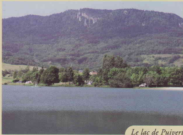
Le lac de Puivert

7. Traverser le hameau, puis tourner à gauche par le "chemin de Campserdou".